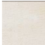
weiß RAL 9010